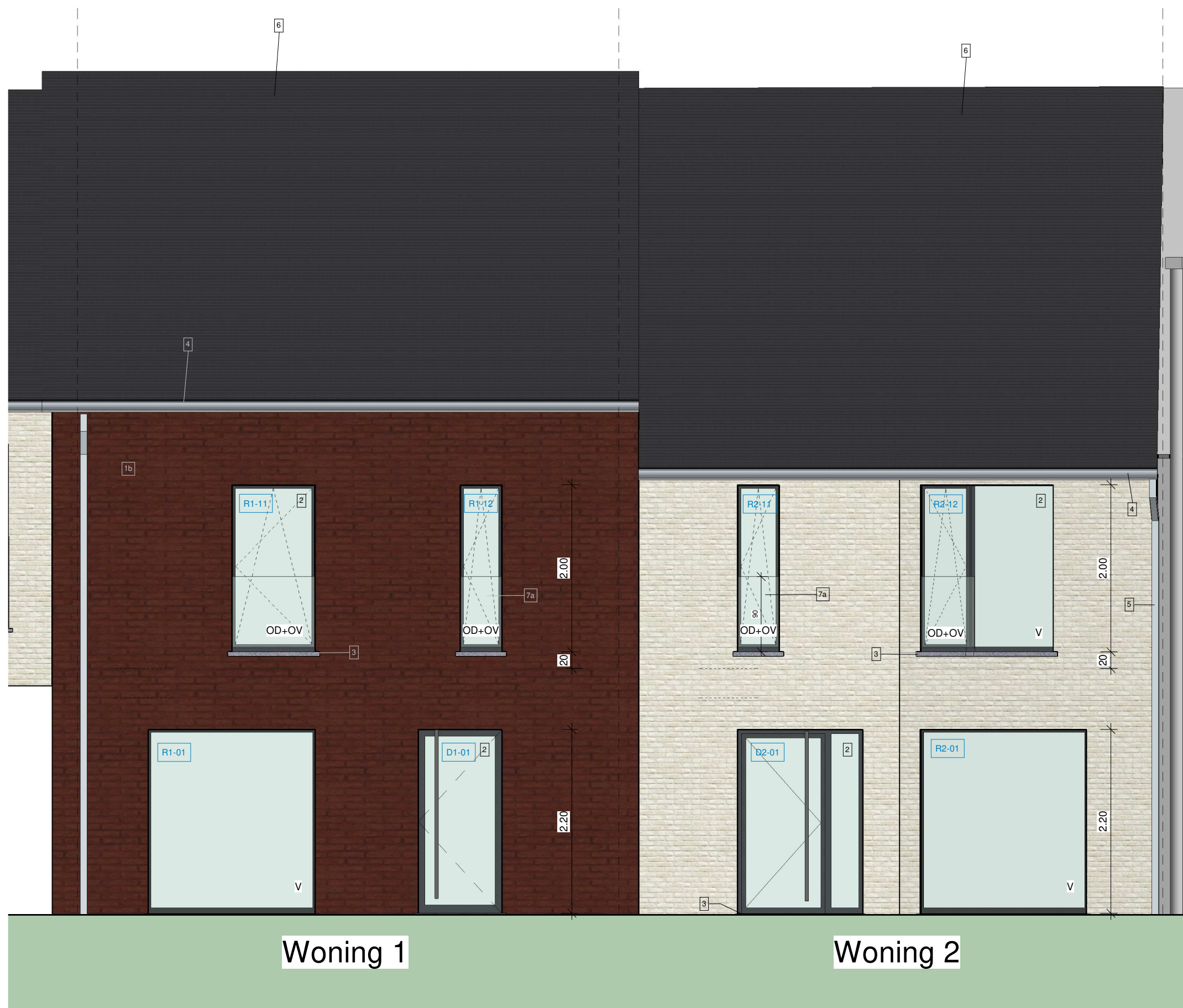
3 Voorgevel 1 : 50

De stabiliteitsstudie (inclusief funderingen en metalen profielen ter ondersteuning dakconstructie) zal opgemaakt worden door een burgerlijk ingenieur. Deze zal een plan en berekening ter goedkeuring aan onderhavige architect voorleggen voor de aanvang van de werken.