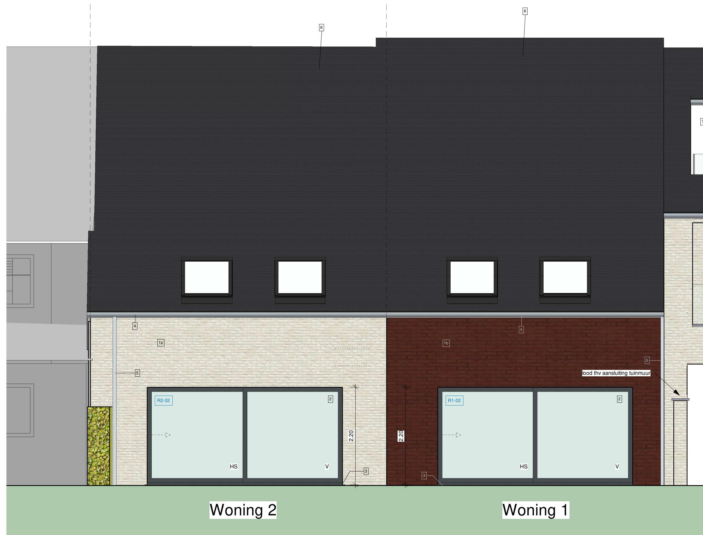
4 Achtergevel 1 : 50

Provincie West-Vlaanderen Gemeente Bredene Woonproject hoek Sluizenstraat-Dorpsstraat